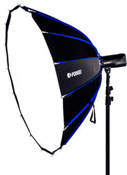
Clickbox FY3560 / FY3561 FY3562 / FY3574 / FY3575 / FY3576 / FY3577