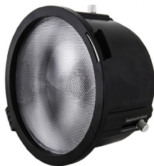
Spot reflector FY3416