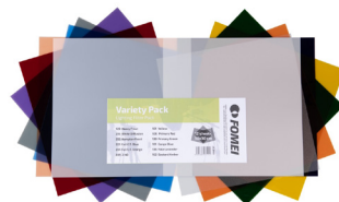
FOMEI barevné filtry ZC8490 - ZC8496